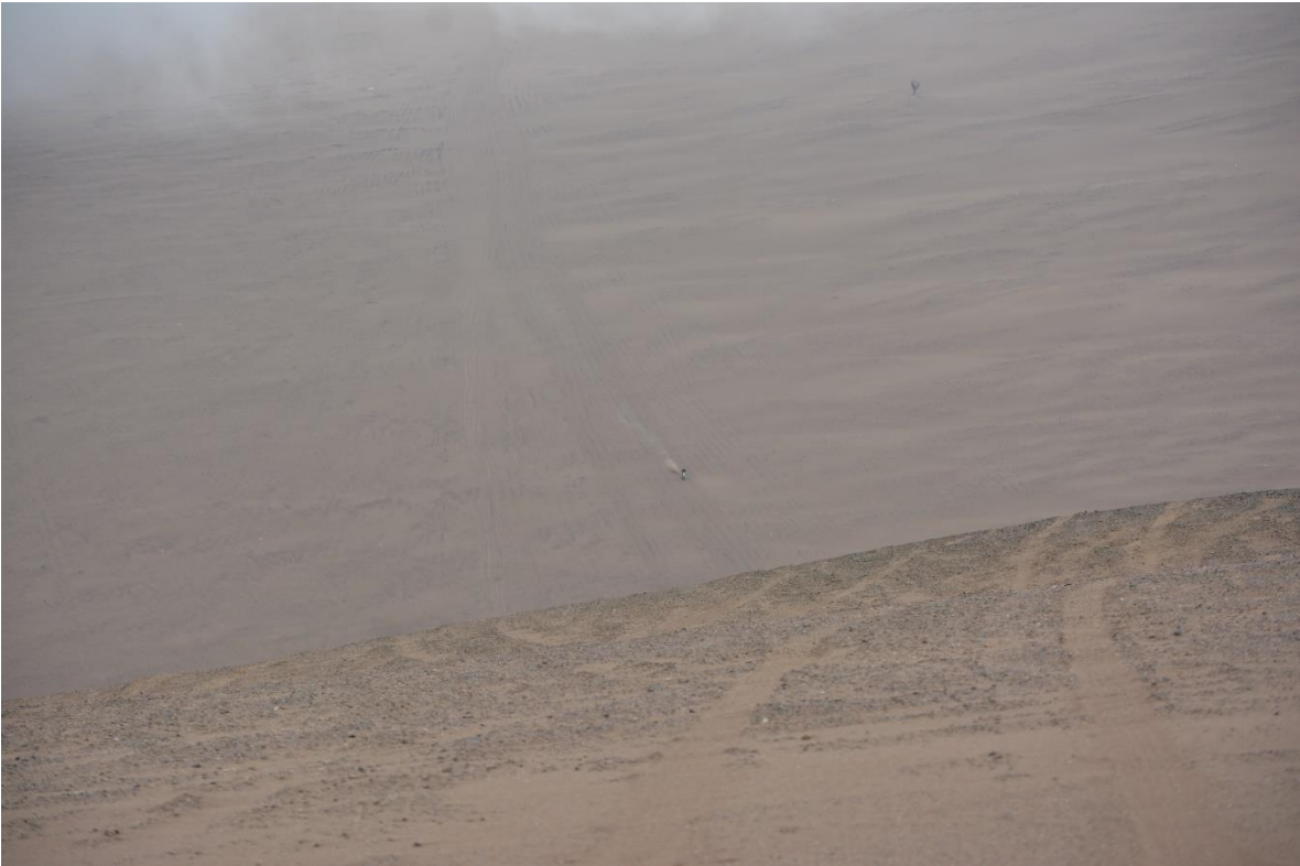
Fotografías de Juan Morales presidente de CORDETUR Corporación de Turismo