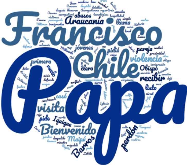
Imagen 1: Nube de palabras titulares principales referidos a la visita del Papa Francisco en su visita a Chile.

Al analizar los titulares principales dedicados a la visita del Papa Francisco a Chile, podemos observar que las palabras utilizadas en los titulares fueron: Papa (29) Francisco (13) Chile (10) bienvenido (4) perdón (4) visita (4) Araucanía (3) violencia (3) y Barros (3).